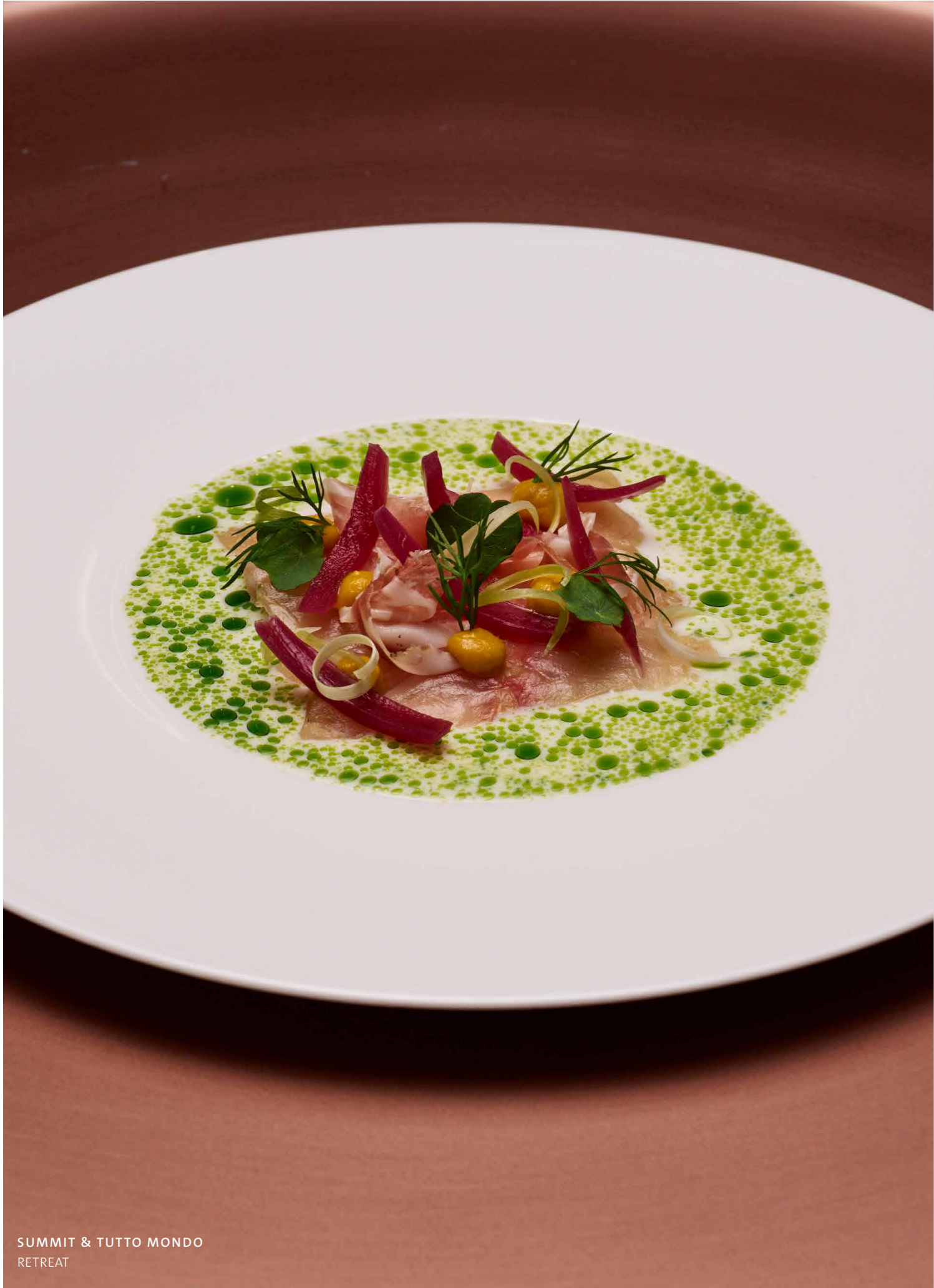
SUMMIT & TUTTO MONDO RETREAT