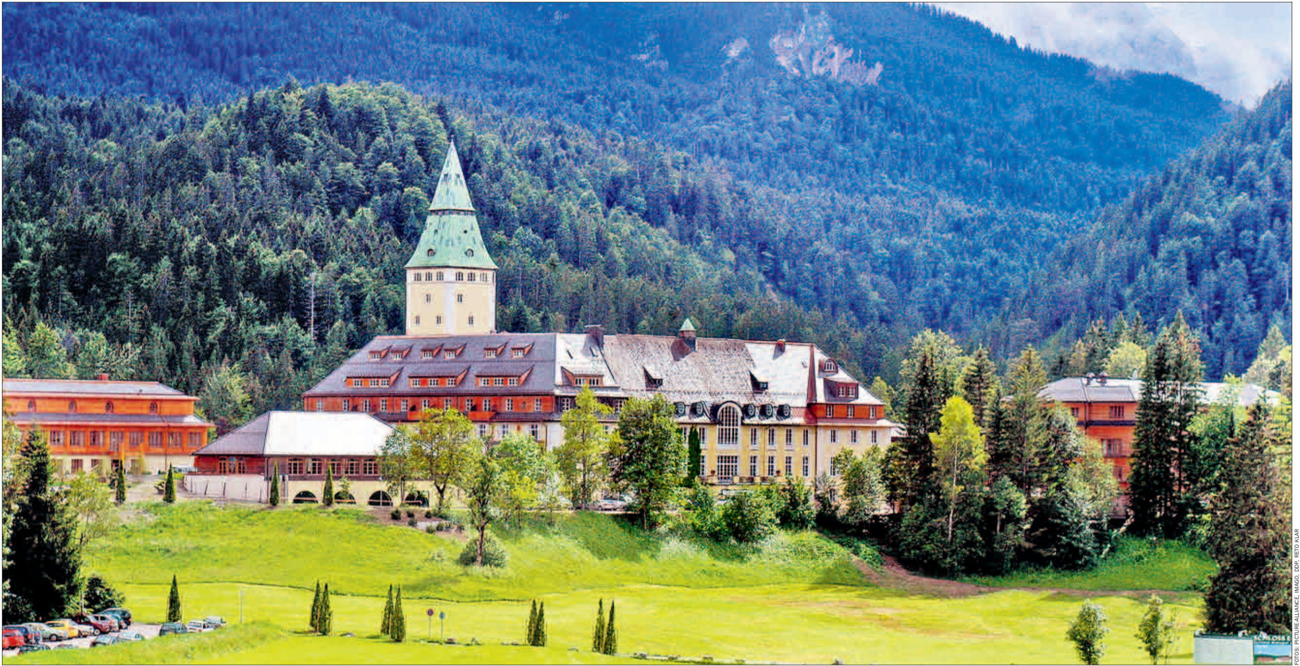
Schloss Elmau heute: 40 Millionen Euro hat Besitzer Müller-Elmau in das renovierte Hotel investiert