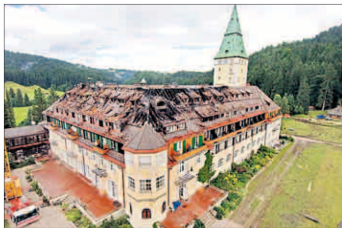
Am Morgen des 7. August 2005 zerstörte ein Feuer die beiden oberen Stockwerke. 20 Stunden löschte die Feuerwehr. Der Brand, ausgelöst durch eine Heizdecke, war hartnäckig. Bis in den Keller schwappte das Wasser

Mark dafür, dass sie ihm eine von seinem Fenster aufs Dach geflogene Briefmarke erkletterte – und er ihr nebenbei unter den Rock schauen konnte.