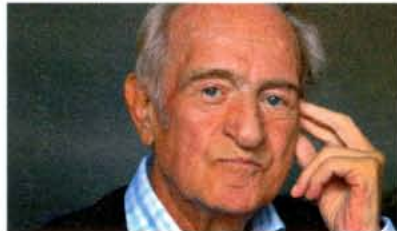
Loriot (oben): „Hier bist Du ein geliebter Gast, auch wenn Du keinen Rüssel hast“