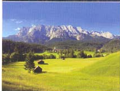
Sommer-Impression in einer Höhe von 1000 Metern, wo sich vor 60 Millionen Jahren der Meeresgrund befand.