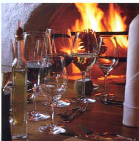
Blick ins Kaminzimmer-Restaurant.