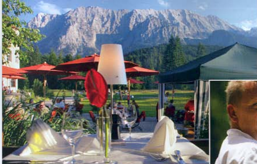
Höchste Ambitionen: Wintergarten, das Gourmet-Restaurant.

140 an der Zahl, individuell gestaltet in 30 Kategorien für Alleinreisende, Paare, für die Familie mit Kindern. Hohe Fenster, grandios der Ausblick auf die majestätische Bergwelt mit ihrem magischen Wetter-Wechselspiel, mal vom Nebel verhangen, mal von der Sonne überglänzt. Die Einrichtung entstand aus Materialien der Region und Asiens. „Weltoffenes Ambiente“, charakterisiert es der Kosmopolit Müller-Elmau. Unbehandeltes Teakholz und rohe Seide verbinden sich mit geölter Eiche und bruchrauem Solnhofer Naturstein, beispielsweise.