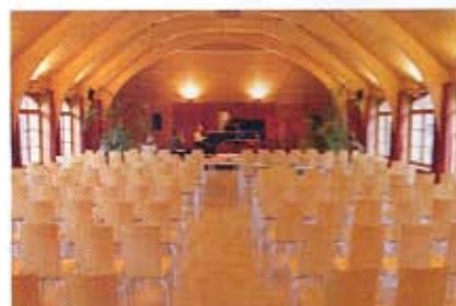
Der Literatursaal. Vom 15. bis 21. Oktober gastieren Autoren, unter ihnen Alexander Kluge und Urs Widmer.

Schloss Elmau. Luxus, Kultur, Kulinarik, der Dreiklang. Cultural Hideaway & Luxury Spas. Ein neues Flaggschiff der Hotellerie mit Superior-Anspruch im geschützten Tal des Ferchenbaches vor der zerklüfteten Wand des Wettersteinmassivs. Zu Gast in einem der noch ökologisch intakten Hochtäler der Alpen. Ganz in der Nähe von Ferchensee und Partnachklamm, eine der berühmtesten Schluchten hierzulande. Im weiteren Umfeld Schloss Neuschwanstein, Hohenschwangau, die Wieskirche und der sagenumwobene Walchensee, mit 192 Metern das tiefste Gewässer in den Alpen. U.M. □