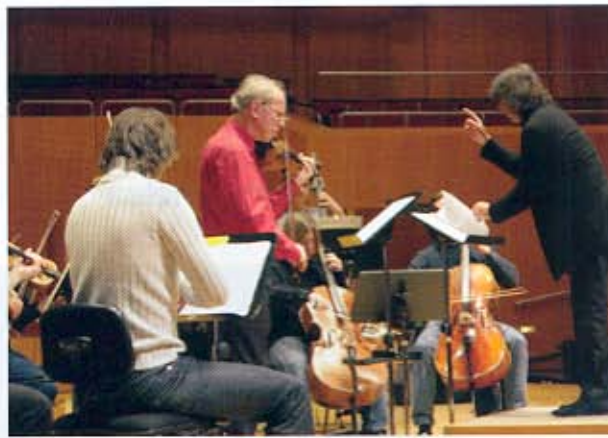
Konzertprobe und „Klassik Inklusive“: Masters & Winners, Schloss Elmau Musikfest und das Festival der ARD-Preisträger vom 17. bis 26. September.