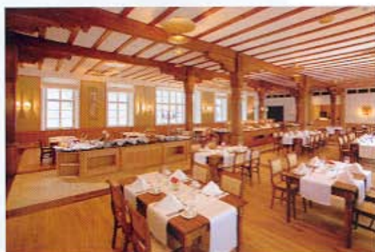
Neues Konzept: Speisesaal mit Live-Cooking-Bufferet.