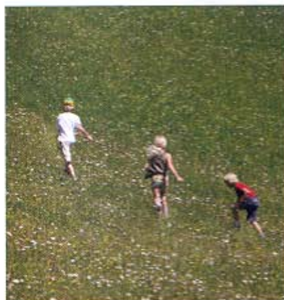
Ein Schloss auch für Kinder: Abenteuer und Kultur.