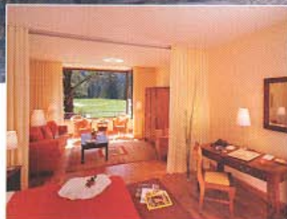
Ansicht eines der großzügig gestalteten Westflügel-Zimmer. Verwandt vornehmlich Materialien aus Asien und der Region.