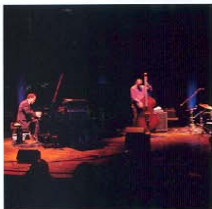
Ein fester Programmpunkt: Jazz-Galas.

Elmau, das Kultur-Schloss. Hochkultur, Tradition verpflichtet. Klassik-, Jazz-, Literatur-Events, Festivals. Der große Konzertsaal fasst 300, der Literatursaal 200 Personen. Außerdem: Teesaal und Kaminsaal Lounges mit Bar und Wintergarten. Allwöchentlich Tanzball mit Standardtänzen und Live Swing, mit klassischer Musik, auch Tango. Zur Verfügung fünf Steinway-Flügel für die Künstler, ein Yamaha-Flügel im Übungsraum für die Gäste. Elmau, auch ein Kultur- und Abenteuer-Schloss für Kinder, ohne ein Kinder-Hotel zu sein. Das „Edutainment“-Angebot in den Ferien: Abenteuer-Programme, betreut von einem Pädagogen-Team; Konzerte und Lesungen. Musik-, Literatur- und Edutainment-Wochen für Philosophie, Naturwissenschaft und Tanz. Geschätzt von „Auszeit“-Eltern: Kinder-Restaurant und Kindergarten.