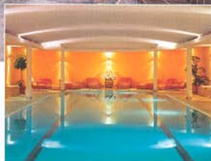
Der Indoor-Pool im Spa-Bereich des Badehauses. Oben: Außenpool mit Blick aufs Wettersteingebirge.

fand: Künstler, Intellektuelle, Musiker, Schriftsteller, Politiker, verstärkt anzutreffen in den Jahrzehnten nach 1945. Elmau erblühte nach Drittem Reich und Weltkrieg von Neuem.