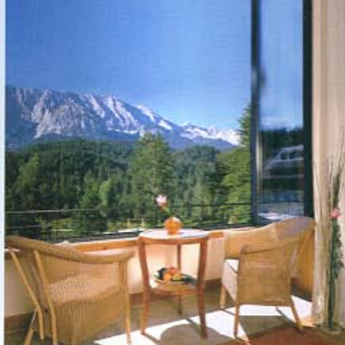
Ruhe, Stille, Muße: Verweilen.