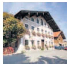
Traditionell: Das Wirtshaus „Hirzinger“

■ Sechs Themenhäuser, zwei Erdhäuser, ein Baumhaus, ein Wasserhaus, ein Gartenhaus und ein Terrassenhaus, dazu Barista-Seminare und Kochkurse (Hofgut Hafnerleiten bei Bad Birnbach, www.hofgut.info)