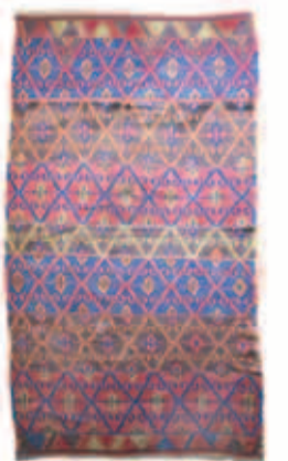
Kelim - Schasavan - alt 240 cm x 160 cm

Maximilianstraße 33 · (neben ROMA) Tel. 089 - 29 41 07 · München www.teppichsaemmer.de