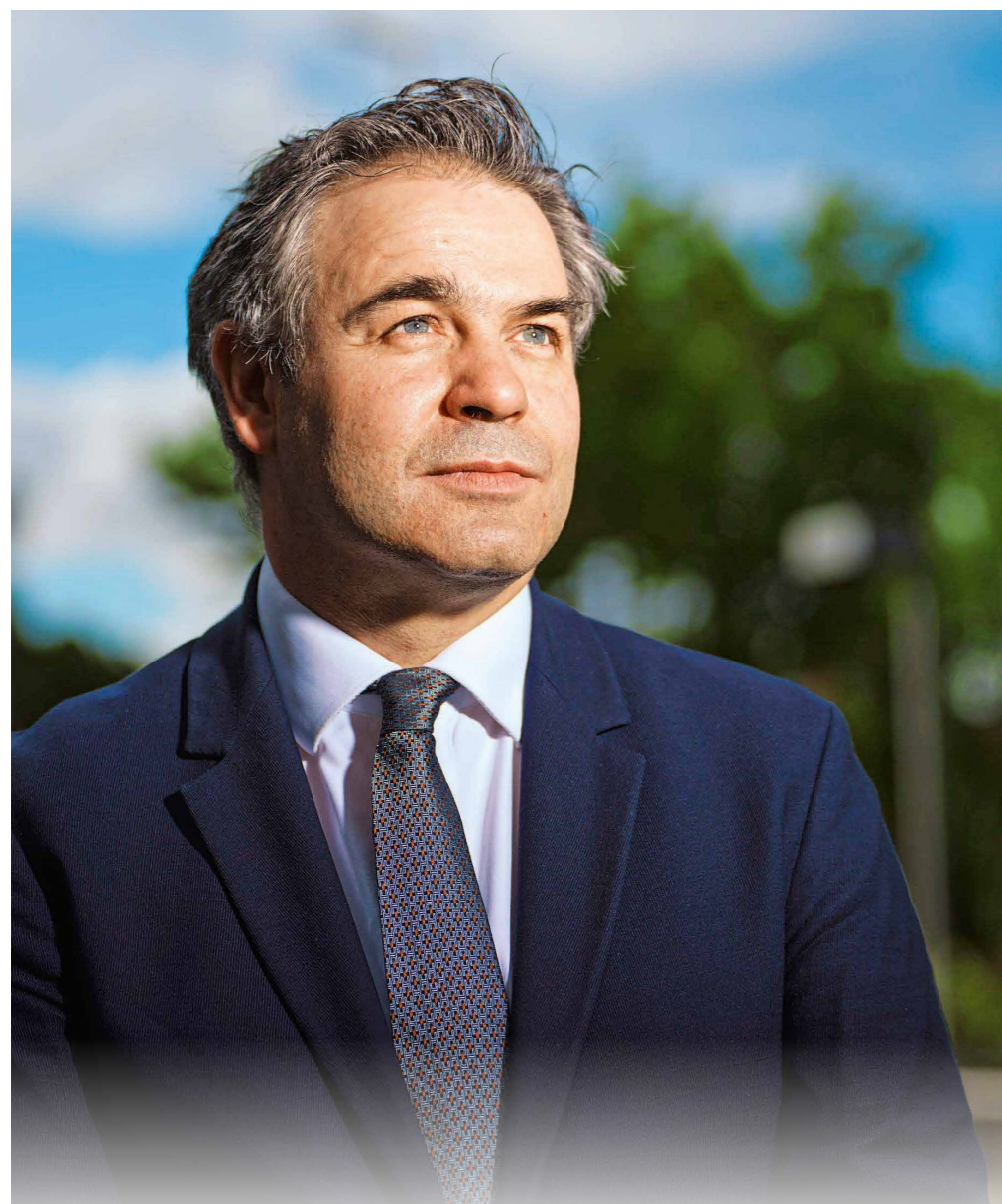
E. MUNDO / IMAGO