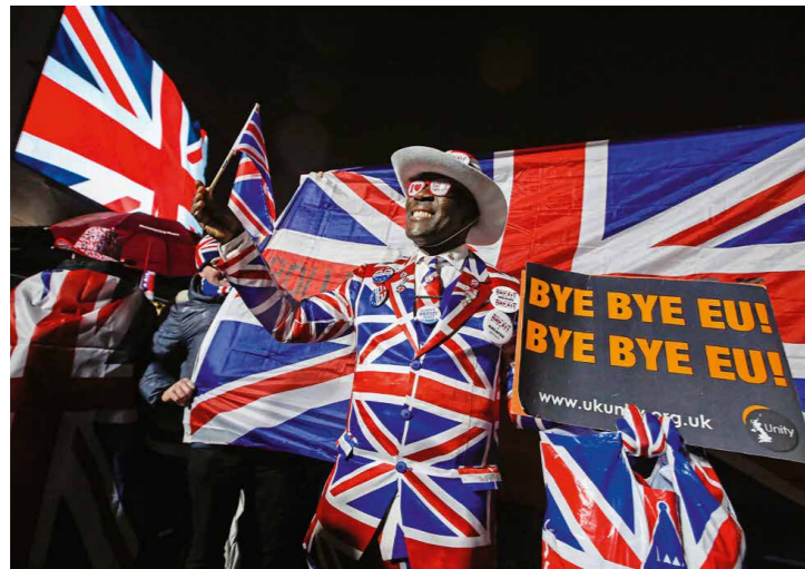
Brexitfeier 2020: Nicht weniger, sondern mehr Plebiszite

hochbegabtes Mathe-Gehirn. Seine Begeisterung für Autoren wie Ernst Jünger oder Hunter S. Thompson. Die langen Nächte im Keller vor dem Computer. Der Hass und die Rebellion der Pubertät. Man kann sich leicht verirren in den »rabbit holes«, den Kaninchenlöchern des Internets.