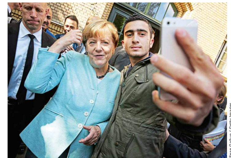
Kanzlerin Merkel mit Flüchtling 2015: Wir schaffen das?

dem Teufel. Beide lächeln, strahlen geradezu. Yarvins Arm um Soros' Schultern. Man könnte meinen, dass Soros vielleicht ein wenig der Umarmung ausweicht und im Blick von Yarvin Triumph aufblitzt, wer weiß. Das Foto hat etwas Gefährliches für beide, man kann es als beiderseitigen Verrat auslegen, es ist ein Wagnis, gleichermaßen Skandal und Sensation. Krastev bat Yarvin darum, es erst zwei Wochen nach der Veranstaltung zu veröffentlichen. Yarvin hielt sich daran. Sein Text auf X: »Die Leute ganz oben sind ebenfalls keine Soziopathen.« Betonung auf »ebenfalls«. 1,1 Millionen Mal wurde der Post gesehen, ein Vielfaches seiner sonsti-