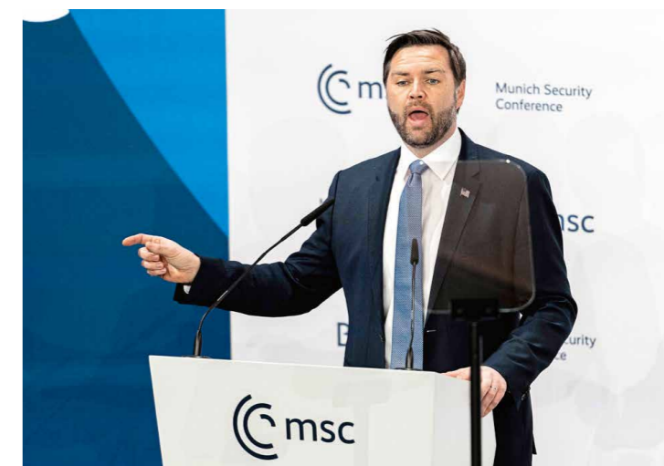
Andreas Stron / IMAGO