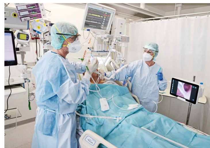
Covidpatient bei Untersuchung 2022: Treibstoff für die AfD

Irgendwann in diesem Gespräch erzählt Krastev, dass er sich an die Aufregung erinnere, das erste Mal nach dem Fall der Mauer wählen zu dürfen, in der Lage zu sein, eine alte Regierung abzulehnen und eine neue zu ermächtigen. Und später fragte er, wie denn Macht in Yarvins neuer Welt von einem CEO auf den anderen übertragen werde. Eine klare, einfache Frage.