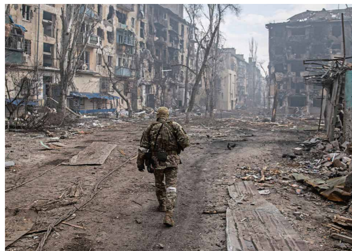
Maximilian Clarke / IMAGO

Die Illusion ist so etwas wie die Stiefschwester der Heuchelei, und eine funktionierende Gesellschaft ohne Illusionen ist kaum vorstellbar. Die Illusion einer Gemeinschaft, die Illusion von Gleichheit nicht nur vor dem Recht, die Illusion von Mitsprache und Volksherrschaft. Aber was passiert, wenn die Fiktionen, die sie erzählen, ihre Plausibilität verlieren?